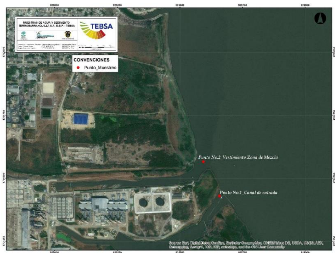
Figura 1. Imagen satelital de TERMOBARRANQUILLA S.A. E.S.P - TEBSA (Lámina tomado de Google Earth y modificada)

Como es de conocimiento de la Autoridad Ambiental, TEBSA capta las aguas de proceso del río Magdalena (Punto No 1), siendo este el mismo cuerpo de agua en el que se lleva a cabo el vertimiento en el Punto No 2 (ver Figura 1), razón por la cual si en el punto de monitoreo de captación y el punto de monitoreo del vertimiento, se presentan valores por encima de 100 mg/l de sólidos suspendidos totales (SST) y/o mayores de 1 ppm para el parámetro Hierro Total, estos no son atribuibles a las actividades industriales o aspectos ambientales de TEBSA, estando fuera de alcance de la Empresa acciones de descontaminación o establecer las razones que dan lugar a esta condición.